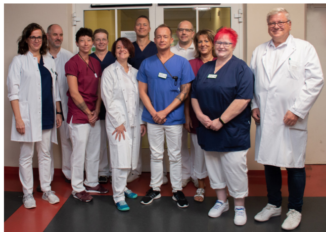
Das Team des EndoProthetikZentrums Saalfeld.

Auf unserer Station werden operative und konservativ zu behandelnde Patienten rund um die Uhr von einem qualifizierten Schwestern- und Ärzteteam betreut. Engagierte Physiotherapeuten nutzen die Behandlungsmöglichkeiten auf den Stationen und im Physiotherapie-Zentrum am Klinikstandort Saalfeld.