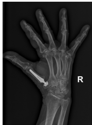
Implantation einer Sattelgelenksprothese

Mit einem Behandlungsverlauf von einem Vierteljahr ist zu rechnen.